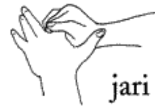
hug finger jari telunjuk